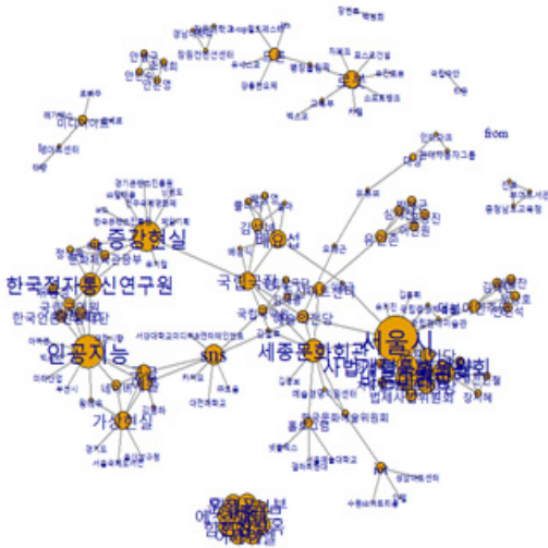
그림 1. 연극 관련 액터의 환경과의 네트워크 (2018~2019)

지로는 인공지능이나 증강현실이 가장 많이 영향을 주고 있는 것을 알 수 있다.